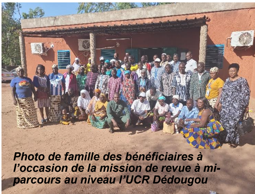
Photo de famille des bénéficiaires à l'occasion de la mission de revue à mi-parcours au niveau l'UCR Dédougou