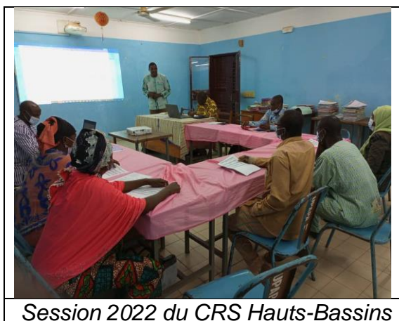
Session 2022 du CRS Hauts-Bassins

Ces outils renseignés sont transmis aux antennes régionales du Projet pour traitement et analyse conformément aux critères de sélection. Ces travaux sont sanctionnés par un rapport d'analyse. Ensuite ce rapport est soumis à l'examen et à la validation du comité régional de sélection lors des sessions. Quant aux bénéficiaires des aménagements (bas-fonds et sites maraîchers), ils sont systématiquement conduits en SPAM à l'issue du processus d'aménagement pour la valorisation. Le schéma ci-dessous montre l'implication des différents acteurs dans le processus.